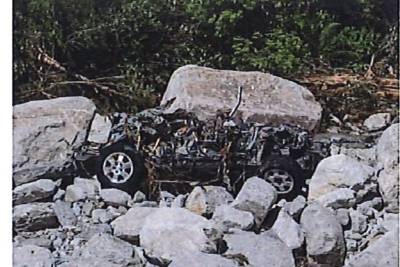
Das Wrack eines Autos, das hoch oben von der Chumme weggespült wurde und nun bei der gkw-Zentrale Heiligkreuz liegt.