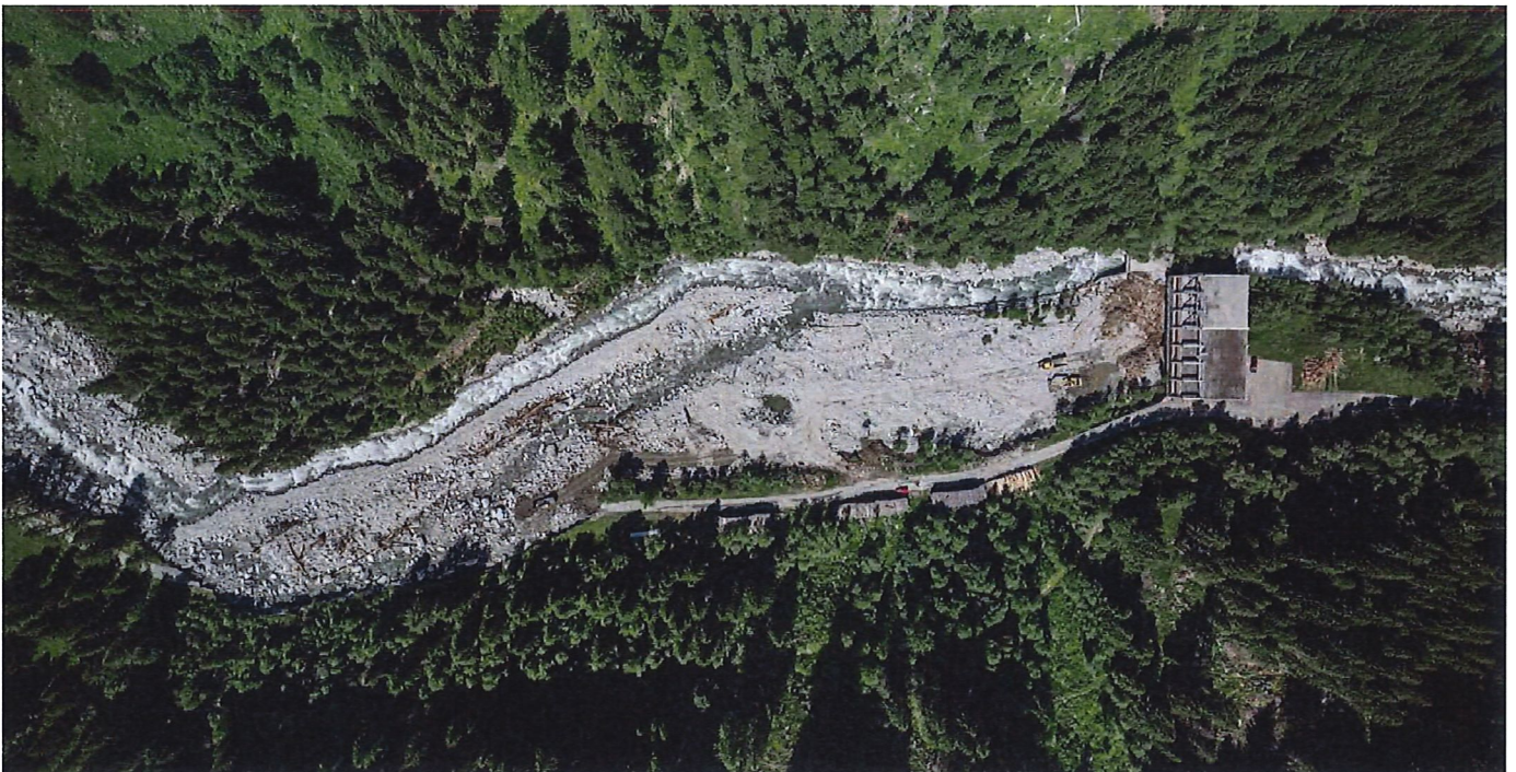
Die graue Geröllfläche war vor wenigen Tagen noch Jungwald, die Strasse zum Weiler Heiligkreuz wurde streckenweise weggespült.

Das Lengtalwasser hat einen neuen Verlauf gefunden, Strassen sind abgerissen, Strom fehlt. Die Situation im Binntal nach dem Unwetter.