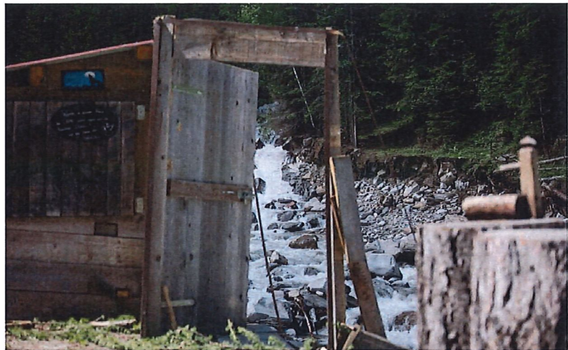
Diese Tür und ein Anbau sind das Einzige, was von einer weggespülten Hütte in Heiligkreuz übrig blieb.

In Heiligkreuz fliessen die Gewässer aus Lengtal, Chriegalp und Saffisch zusammen. Und vor zehn Tagen flossen sie über. Auch hier wähnt man sich in einem Flussbett. Wäre da nicht die Grillstelle. Inmitten des ver-